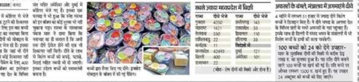
कारिगर में दीये टूटने की शिकायत मिलने पर इस बार मोबाइल के वेस्ट बॉक्स में किए पेकिंग, 51 हजार से ज्यादा दीयों की बिक्री से डेढ़ लाख का फायदा।

शिविर शर्मा के कलात्मक दीये पेकिंग में नवावा... दीवारती पर कलात्मक दीयों की मांग इस बार भी