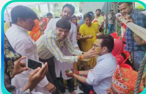
Haldi Ceremony Celebration in Divyang Vivah Sammelan at Ujjain