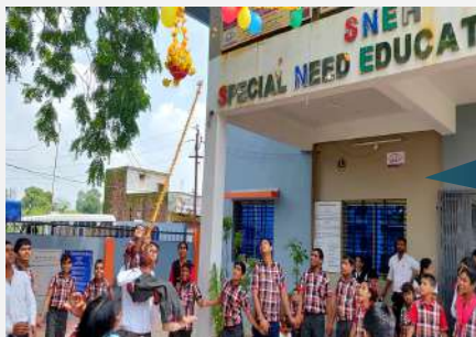
जन्माष्टमी पर्व के अवसर पर स्नेह के बच्चों ने मटकी फौड़ प्रतियोगिता में सहभागिता कर कृष्णा जन्म उत्सव आनंद पूर्वक मनाया |