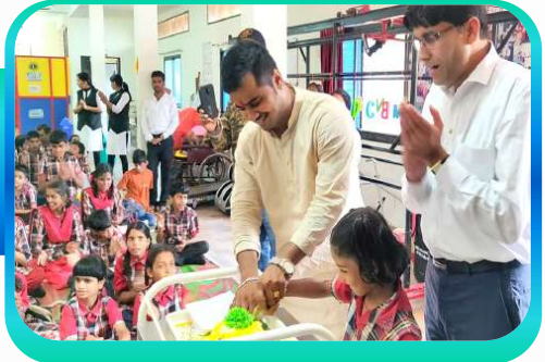
Hon Minister Grant Son Birthday Celebration with our PWIDDs