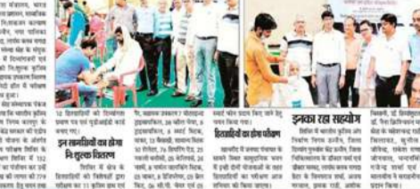
शिविर में 152 दिव्यांगजनों एवं वृद्धजनों का हुआ परीक्षण।

15.60 लाख की लागत के नि:शुल्क स्वास्थ्य प्रकरण क्षेत्र में शिविर, आज सावरी में परेक्षण शिविर