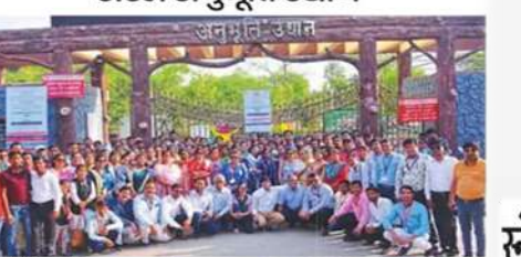
पांच राज्यों के पुर्नवास विशेषज्ञों ने देखा सुगम्य महाकाल मंदिर व समावेशी अटल अनुभूति उद्यान।