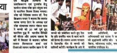
कारगिल विजय दिवस पर दी श्रद्धांजलि।