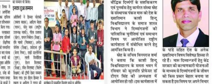
काशी हिन्दू विश्वविद्यालय में राष्ट्रीय कार्यशाला को संबोधित करेंगे मारु।

नागदा जं. (निप)। लार्जर्स ऑफ नागदा की स्मार्ट परियोजना एवं बौद्धिक दिव्यांगों के सशक्तिकरण एवं पुनर्वास हेतु कार्यरत 'स्नेह देश' को दिव्यांग संस्था के लिए राष्ट्रीय पुरस्कार से सम्मानित किया गया।