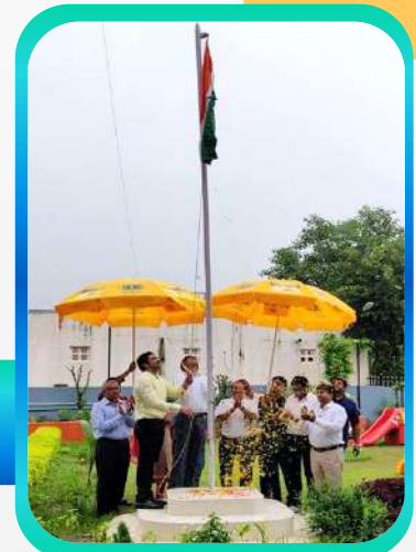
Independence Day Celebration