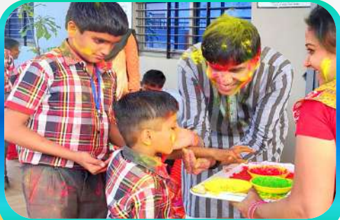
Holi Festival Celebration with our Special Needs Kids