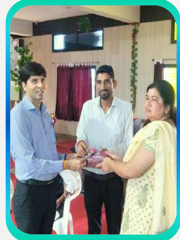
Teacher's Day Celebration